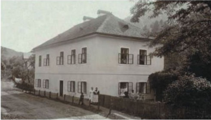
Pohľadnica vily Dvíhalý z roku 1905

Koncom roku 2023 odkúpili vilu majiteľa rezortu Fabrika a vila očaká kompletnú rekonštrukcia s obnovením pôvodnej funkcie vily.