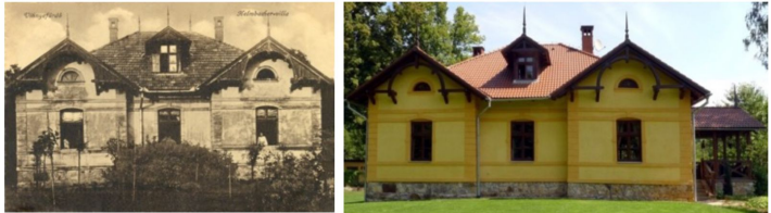
Porovnanie priečelia na vile v roku 1910 a v roku 2014